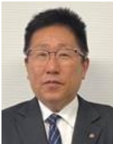
京都府地域政策室長 北村 哲也

関西エリアの持続的な発展に向けて、主要都市である京阪神を中心に新たな価値を創造するため、産学官の共創の在り方、これからのまちづくりの方向性について、イノベーションの創出を軸に議論を深めます。