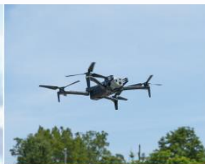
ドローン操縦体験・飛行デモ