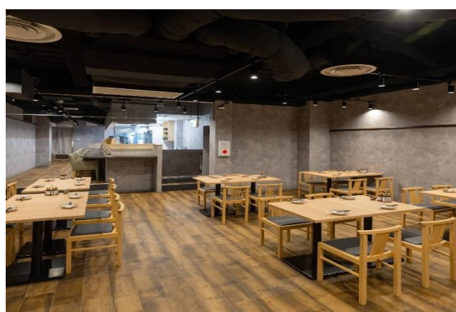
生産者直営 海鮮居酒屋 Rikusui