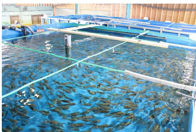
陸上養殖モデルルーム